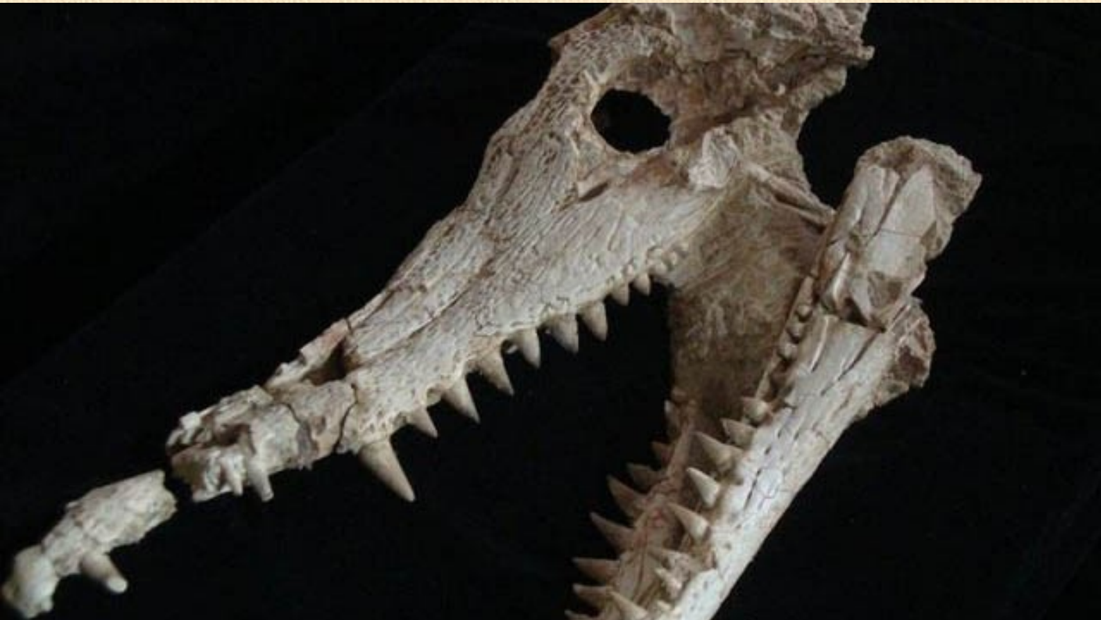
Crâne de Oxalaia quilombensis.

« C'est la première fois que nous voyons deux dents de substitution associées à une dent fonctionnelle, ce qui veut dire que ses dents repoussaient très vite » indique la paléontologue.