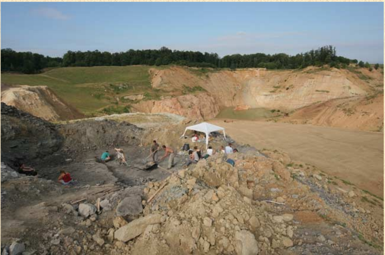
Le site de fouilles où ont été découverts les os du crâne de l' Ajkaceratops kozmai, en Hongrie.