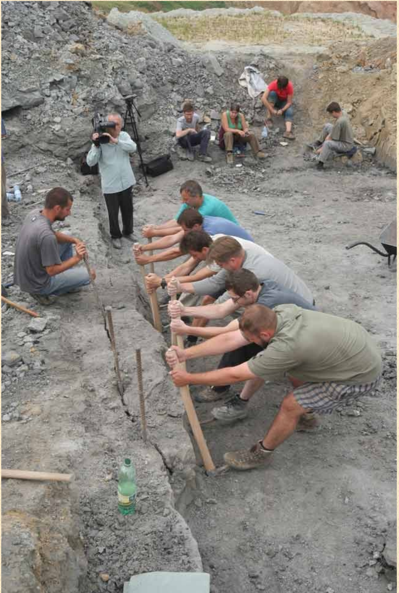
Fouilles durant lesquelles ont été découverts les os du crâne de l'Ajkaceratops kozmai, en Hongrie. (Gábor Czirják)